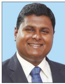
ജെ. പി. വെണ്ണിക്കുളം